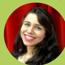
Marjorie Bispo Comunicação